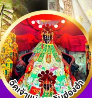
อิตเจ้าแม่กวนอิมฮ่องฮัก