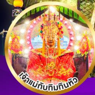
เจ้าแม่ทับทิมกินหัว