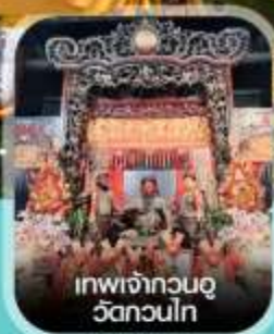
เทพเจ้ากวนอู วัดกวนไท่

✈️ คอนเฟิร์มออกเดินทาง ทุกพีเรียด 2 ท่านขึ้นไป ✈️