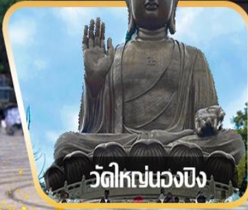
วัดใหญ่หนองปิง