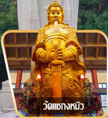
วัดเขangkงมียว