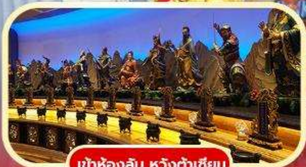
เข้าห้องลับ หวังต้าเซียน