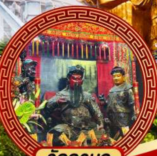
วัดกวนอู