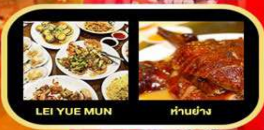
LEI YUE MUN