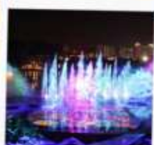
โชว์น้ำสามมิติ OCT BAY WATER SHOW