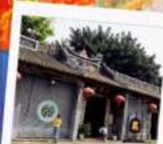
วัดกวนอูเซินเจิ้น