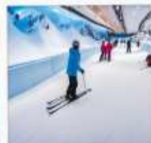
บ้านหิมะ WINDOW OF THE WORLD