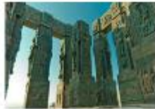
CHRONICLE OF GEORGIA

** พักที่ Clock Town Hotel หรือเทียบเท่า **