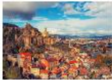
เมืองทбилиซี

05.20 น. เดินทางถึงสนามบินอิสตันบูล แวะเปลี่ยนเครื่อง 06.55 น. ออกเดินทางสู่สนามบินทбилиซี เที่ยวบิน TK378 09.45 น. เดินทางถึงสนามบินทбилиซี ประเทศจอร์เจีย