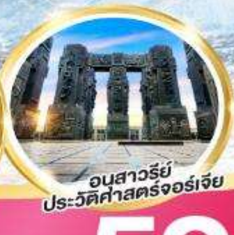
อนสาวรีย์ประวัติศาสตร์จอร์เจีย