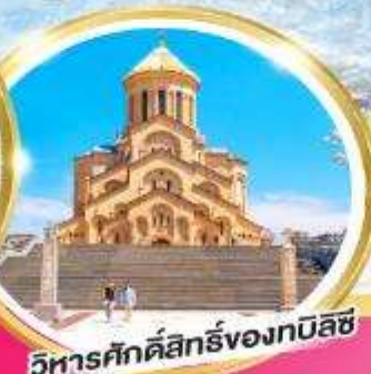
วิหารศักดิ์สิทธิ์ของทบิลีซี