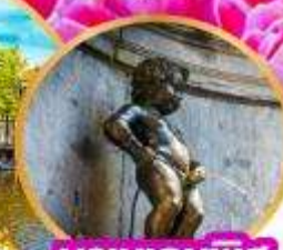
มานเคนพิส