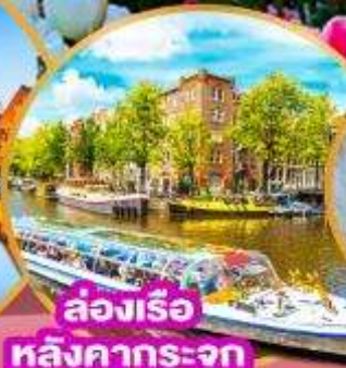
ล่องเรือ หลังคากระจุก