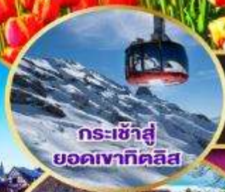
กระเช้าสู่ออกเขาทาคิลิส