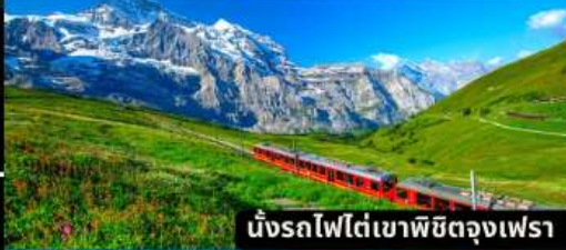
นั่งรถไฟใต้เขาพิชิตดงเฟรา