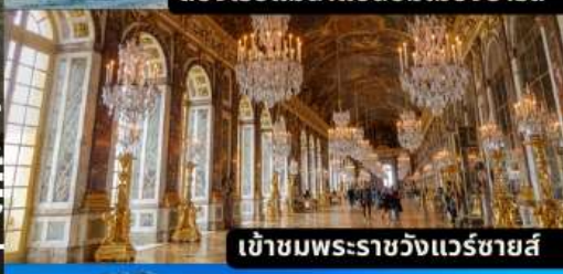
เข้าชมพระราชวังแวร์ซายส์