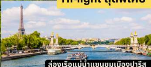
ล่องเรือแม่น้ำแซนชมเมืองปารีส