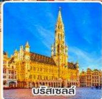
บรัสเซลส์