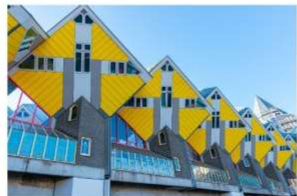
บ้านลูกเต๋าโค้คคุมุส

นำท่านถ่ายรูปกับ บ้านลูกเต๋าโค้คคุมุส (Kijk Kubus The Cubic Houses) กลุ่มอาคารเหลืองขาวทรงลูกเต๋า 39 หลัง ซึ่งได้รับรางวัลชนะเลิศการออกแบบสาขาประหยัดพลังงาน โดยสถาปนิกนาม Piet Bloem