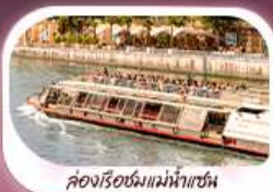
คองเรือชมแม่น้ำแซน