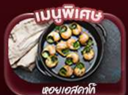
เมนูพิกนิก