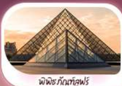
พิพิธภัณฑ์ลูฟร์