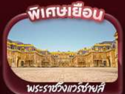
พิกนิกในเมือง พระราชวังแวร์ซายส์