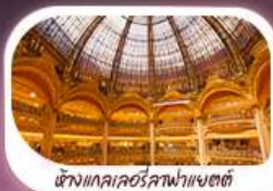
ห้างแลคซอร์คอฟ้าแซตต์