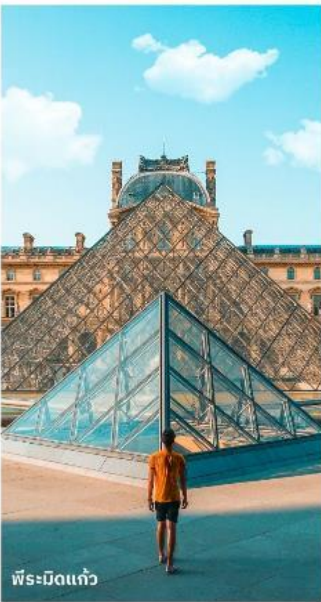
พีระมิดแก้ว

เดินทางสู่ พิพิธภัณฑ์ลูฟร์ ให้ท่านได้ถ่ายรูปด้านหน้า พีระมิดแก้วของพิพิธภัณฑ์ลูฟร์ เป็นพิพิธภัณฑ์ทางศิลปะที่มีชื่อเสียงที่สุด เก้าแก่ที่สุดและใหญ่ที่สุดแห่งหนึ่งของโลก