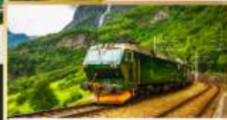
รถไฟสายฟลิมส์บาน่า