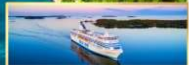
เรือ Tallink Silja Line