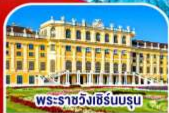
พระราชวังซีรินบรุน