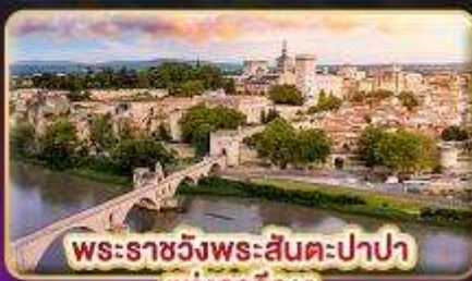
พระราชวังพระสันตะปาปา แห่งอเวญู