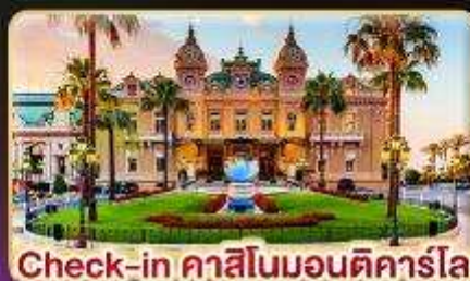
Check-in คาสีโนมอนติคาร์โล