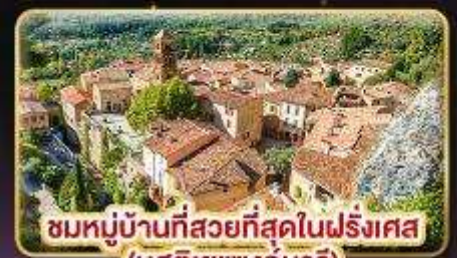
ชมหมู่บ้านที่สวยงามที่สุดในฝรั่งเศส (มูสตียาแซงท์มาร์)