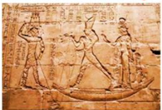
วิหารเอ็ดฟู