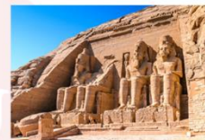
มหาวิหารอาบูซิมเบล

** พักที่ JAZ Crown Jewel Nile Cruise 4* หรือเทียบเท่า **