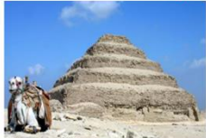
พีระมิดชั้นบันได