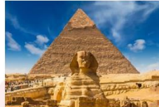
มหาพีระมิดกิซา