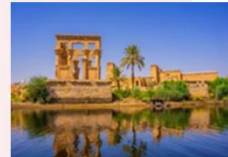
วิหารฟิเล

16.25 น. ออกเดินทางสู่กรุงโคโร สายการบิน Egypt Airlines เที่ยวบิน MS295