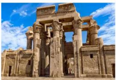
วิหารคอมมอโบ