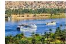
พักผ่อนตามอัธยาศัย บนเรือสำราญ

** พักที่ Royal Beau Rivage Nile cruise 5* หรือเทียบเท่า **