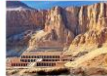
วิหารอ็คเซฟซุต