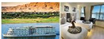
เรือสำราญแม่น้ำไนล์

** พักที่ Royal Beau Rivage Nile cruise 5* หรือเทียบเท่า **