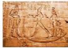
วิหารเอ็ดฟู