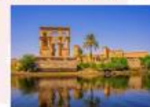
วิหารฟิเล

16.25 น. ออกเดินทางสู่กรุงไคโร สายการบิน Egypt Airlines เที่ยวบิน MS295