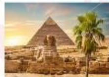
มหาพีระมิดกิซา

** พักที่ Eurostars Granada Hotel 4* หรือเทียบเท่า **