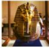
The Egyptian Museum

** พักที่ Mamlouk Pyramids Hotel 4* หรือเทียบเท่า **