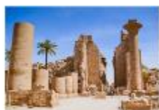
มหาวิหารคาร์นัค

xx.xx น. ออกเดินทางสู่เมืองลักซอร์ เที่ยวบิน... xx.xx น. เดินทางถึงสนามบินลักซอร์