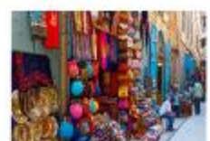
ตลาดข่านเอลคาลิลี

20.50 น. ออกเดินทางสู่อิสตันบูล เที่ยวบิน TK695