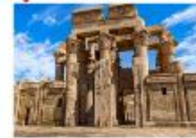
วิหารคอมมอโบ