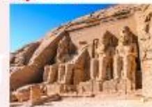
มหาวิหารอาบูซิมเบล

** พักที่ Royal Beau Rivage Nile cruise 5* หรือเทียบเท่า **