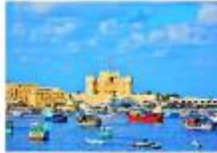
เมืองอเล็กซานเดรีย

** พักที่ Mamlouk Pyramids Hotel 4* หรือเทียบเท่า **