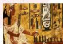
พิพิธภัณฑ์สถานแห่งชาติอียิปต์