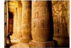
วิหารมาดินัตอาบู

** พักที่ Royal Beau Rivage Nile cruise 5* หรือเทียบเท่า **