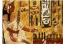
หุบผาซัคเรีย