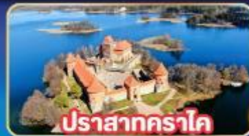
ปราสาทกราโด