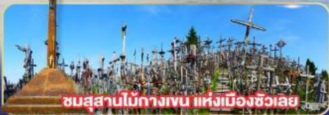
ชมสุสานไม้กางเขน แห่งเมืองซีวเลย์