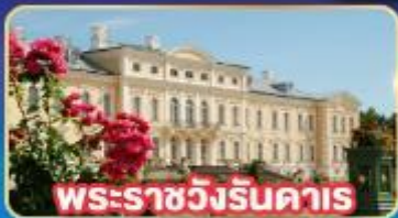
พระราชวังรินคาส