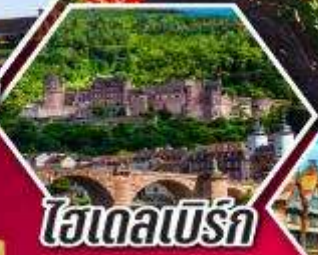
ไฮเดลเบิร์ก