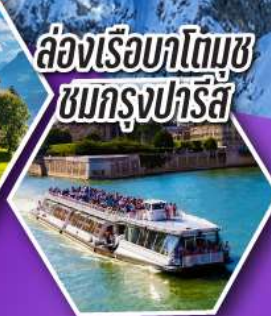
ล่องเรือบาโตมูซ ชมกรุงปารีส

เที่ยวเมืองวาอูซ เมืองหลวงของสาธารณรัฐ ลิกเทินสไตน์