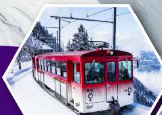
นั่งรถไฟใต้เขาริก