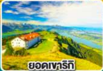
ยอดเขารัทท์