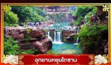
อุทยานหยุนโกซาน

“เซียน” อารยธรรมโบราณอายุสามพันปี มหาสุสานของจักรพรรดิจีน ..จีนชื่องัด