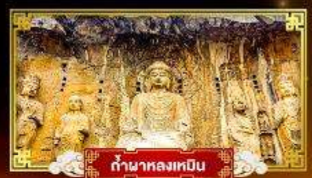
กำแพงหลงเหมิน