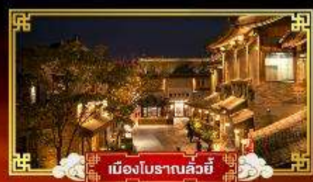
เมืองโบราณลวี้