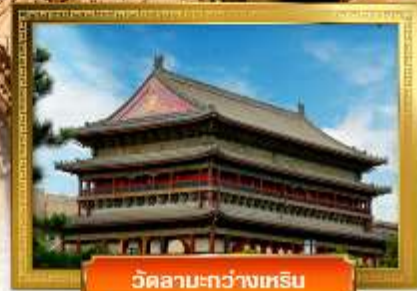
วัดลามะ-กว้างเหิน