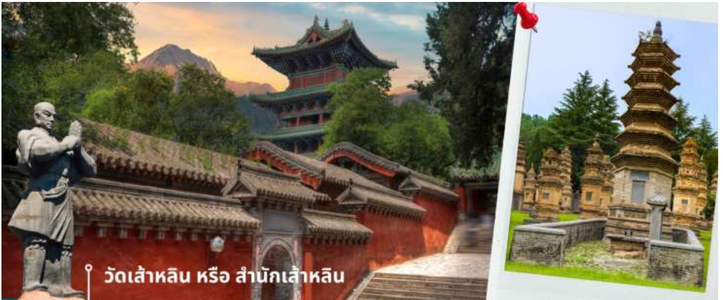
วัดเส้าหลิน หรือ สำนักเส้าหลิน

นำท่านชม ป่าเจดีย์ หรือ ถ้ำหลิน ซึ่งมีอยู่ราว 230 ที่มีความเก่าแก่ เป็นสถานที่ศักดิ์สิทธิ์ที่ตั้งอยู่ภายในบริเวณวัด ซึ่งเป็น