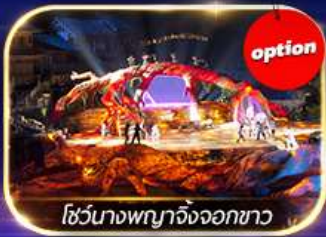
โชว์นางพญาจิ้งจอกขาว