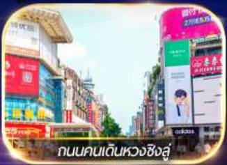
ถนนคนเดินหวงซิงสู๋

ล่องเรือชมเมืองโบราณ ฟุรงเจิน + ทะเลสาบเป่าเฟิงหู