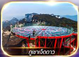
ภูเขาเจ็ดดาว