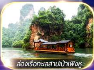
ล่องเรือทะเลสาบเป่าเฟิงหู