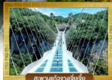
สะพานแก้วจางเจียเจีย