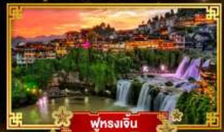
ฟุรงเจิน