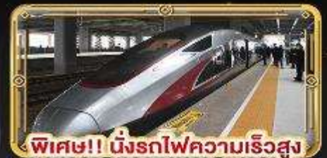
พิเศษ!! นิ่งรถไฟความเร็วสูง