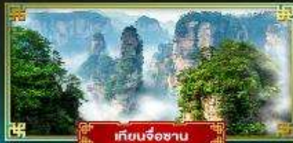
เทียนจ้อซาน