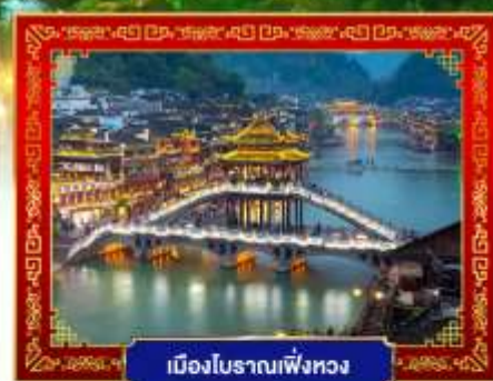
เมืองโบราณเพ็ญทง