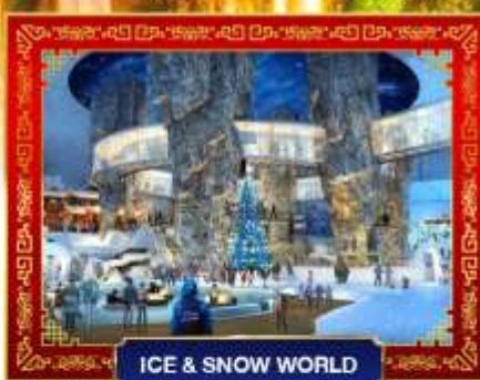
ICE &amp; SNOW WORLD