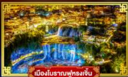
เมืองโบราณฟุ่หลงเจิน

เที่ยว 2 เมืองโบราณ ๓: ๓ เมืองใหม่: "ICE & SNOW WORLD"