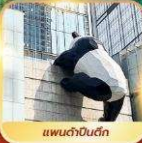
แพนด้าปิ่นตึก