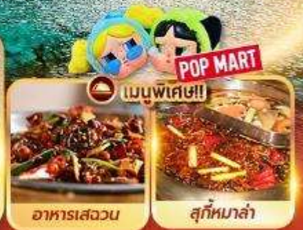
อาหารเสฉวน