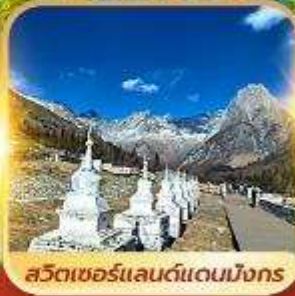
สวิตเซอร์แลนด์แดนมังกร