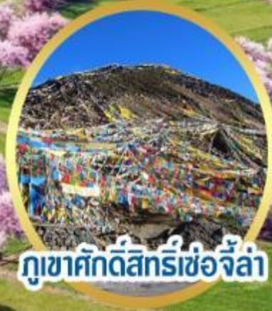
กุเขาศิกัดีสตรีเชอจีลา