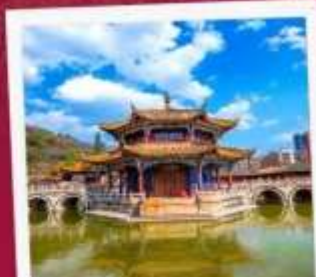
วัดหยวนทอง