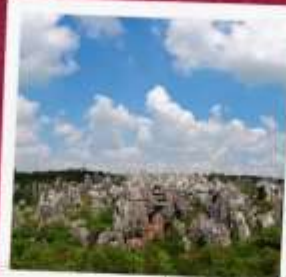
อุทยานป่าหิน