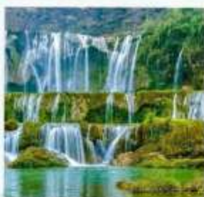
น้ำตกเก้ามังกร