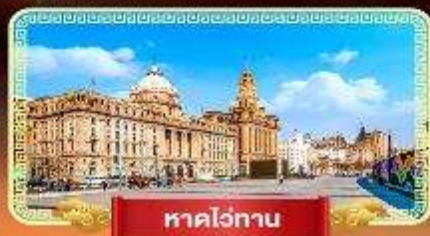
หาดวอทาน

★ ตะลุย 2 สวนสนุก ดิสนีย์แลนด์ + POPLAND