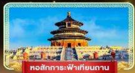
หอสังเกตการณ์เทียนถาน