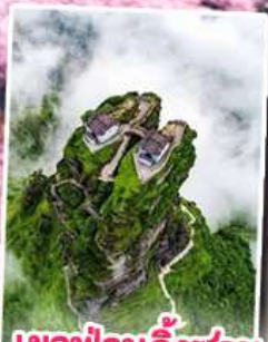
อุทยานกุหลาบพันปี หมู่บ้านแม่วชิเจียง