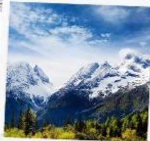
ภูเขาหิมะการ์เซีย ตำกู่ปิงชวน