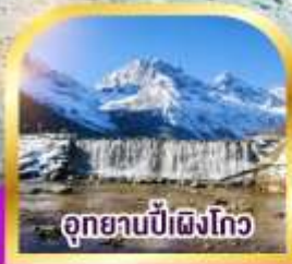
อุทยานบี้เผิงโกว