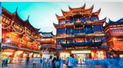
ตลาดร้อยปีเงินหวังเหมียว