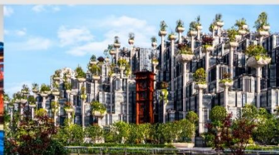
Tian An 1,000 Trees