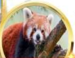
ศูนย์วิจัยหมีแพนด้า

📍ไฮไลต์!!! เที่ยว 2 อุทยาน 3 เขาพักบนเขาซีหลิง ช้อปปิ้งจุกๆ ถนนคนเดินจิ่งหลี่ ชุนซีลู่ ไท่กู่ลี POPMART เซ็คอินดิก IFS ย้อนยุคกลับไปเมืองโบราณดูเจียงเยียน พักดี 4-4+ ดาวตลอดการเดินทาง