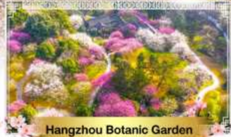
Hangzhou Botanic Garden