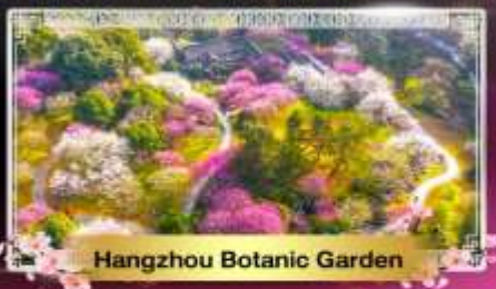
Hangzhou Botanic Garden