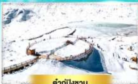
คำกู่ปิงชว