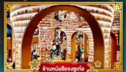
ร้านหนังสือจขงชวเก๋อ