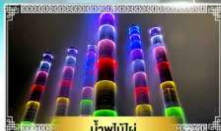
น้ำพุไม้ไผ่