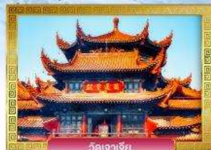
วัดเจาเจีย