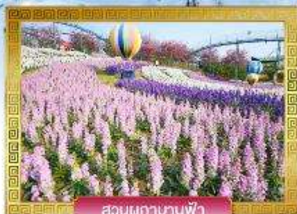
สวนผักกาดบานฟ้า