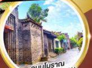
ถนนโบราณ ชอยกว้างชอยแคบ