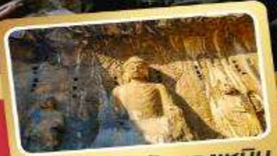
ผาแกะสลักหลงเหมิน