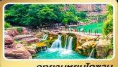
อุทยานหยุ่นโกซาน