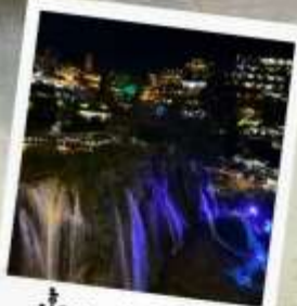
น้ำตกฟูหรงเจิน