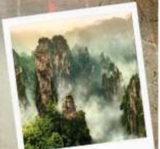
เขาวงตาร