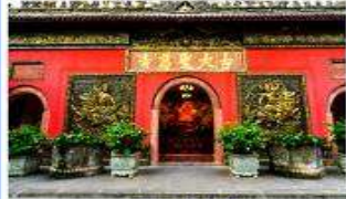
วัดต้าเจี๊ว