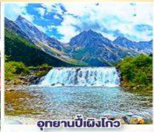
อุทยานปี้เผิงโกว