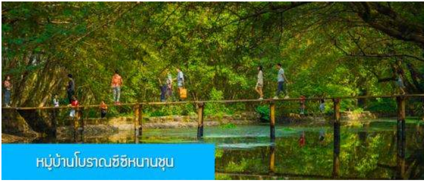
หมู่บ้านโบราณซีซีหนานซุน