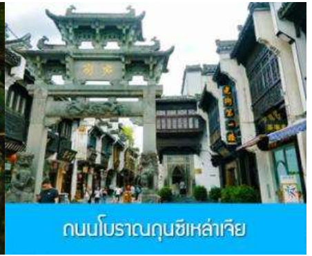
ถนนโบราณกุนซีเหล่าเจีย

วันที่หก เมืองหวงซาน –หมู่บ้านโบราณซีซีหนานซุน –อิสระ ณ ถนนโบราณกุนซีและย่านศูนย์การค้า – เดินทางกลับกรุงเทพฯ