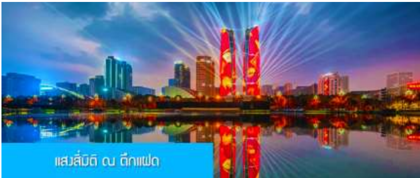
แสงสีมิตติ ณ ตึกแฝด