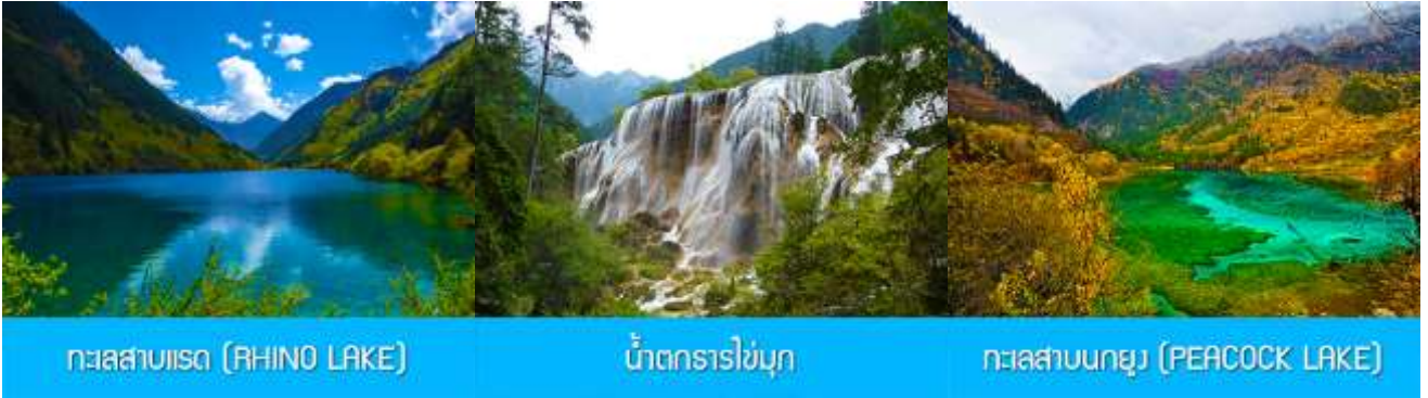
ทะเลสาบยว (RHINO LAKE)