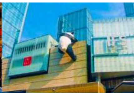
หมีแพนด้าปีนตึก ณ ตึก IFS